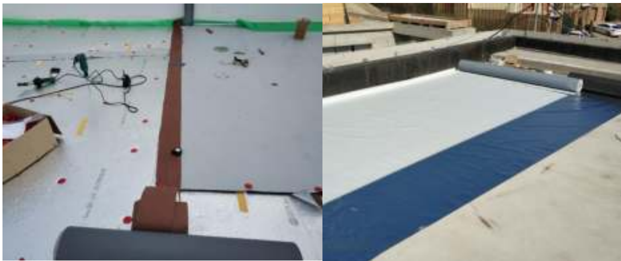
Рисунок 2. – Устройство мембранной мягкой кровли с разделительным слоем из материала Контролит

Слой Контролит, являясь самостоятельным элементом кровли, в комбинации с электроискровым методом неразрушающего контроля представляет собой систему предупреждения ее протечек (рис. 2 и 3).