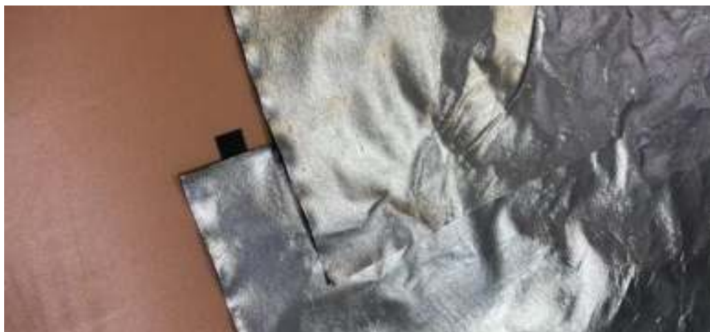
Рисунок 7. – Внешний вид «Контролит ПП» для формирования контрольного разделительного слоя Контролит под водоизоляционным ковром

Параллельно команда проекта вела разработку новых материалов, обладающих повышенным уровнем воздухопроницаемости и устойчивости контрольного разделительного слоя Контролит к агрессивным щелочным средам в зоне контакта с цемент-содержащими материалами выравнивающих стяжек по сравнению с Контролит ПП.