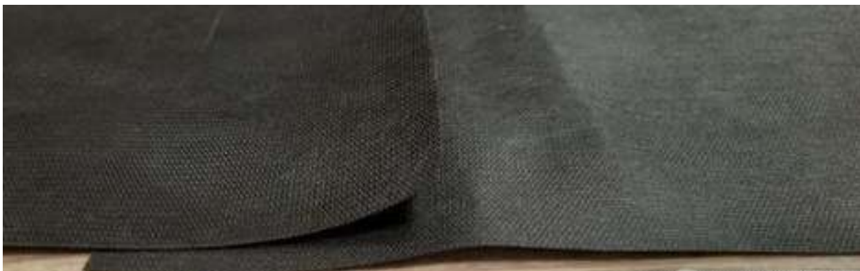
Рисунок 8. – Внешний вид нового токопроводящего материала Контролит СП, уложенного внахлест

Электропроводящий материал «Контролит СП» на сегодня это базовый продукт компании, предназначенный для использования на цемент-содержащих основаниях для устройства системы предупреждения протечек Контролит на гидроизоляционные системы подземного типа (гидроизоляция фундаментов), а также для кровель с минераловатным утеплителем. Материала «Контролит ПП» остается в продуктовой линейке для применения на кровлях, где отсутствуют требования по воздухопроницаемости разделительных слоев. Например, на кровлях с гидрофобными утепляющими материалами (экструдированный пенополистирол, PIR), а также с плитными основаниями на древесной основе.