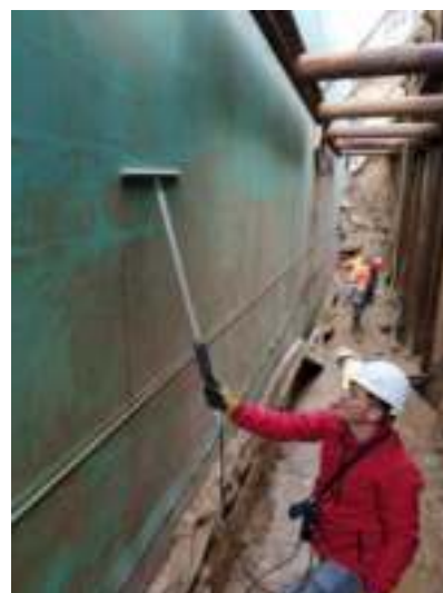
Рисунок 4. – Контроль герметичности гидроизоляции фундамента с помощью электроискрового кровельного дефектоскопа ИЗОТЕСТ 2.0