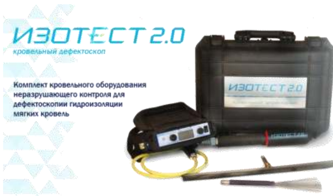
Рисунок 5. – Кровельный дефектоскоп Изотест 2.0

Начиная с 2016 года команда проекта работает над совершенствованием и расширением номенклатуры материалов Контролит и оборудования Изотест (Изотест 2.0, Изотест Pro и Изотест On-line). С самого начала проекта было принято решение о реализации производственной стратегии на базе отечественных производств и материалов. В ходе реализации проекта учитывался опыт иностранных компаний для решения схожих задач, например, компаний Detec (США, Канада), Buckleys (Великобритания), Trotec (Германия) и других, которые были слабо представлены на отечественном рынке из-за высокой стоимости их