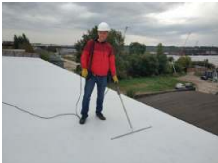
Рисунок 3. – Контроль целостности водоизоляционного ковра кровли из ПВХ мембраны с помощью электроискрового кровельного дефектоскопа ИЗОТЕСТ 2.0